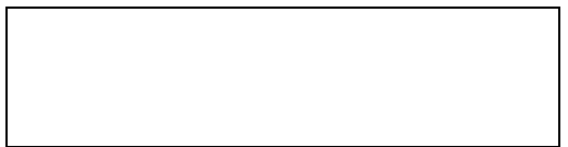
Схема границы балансовой принадлежности

е) границей эксплуатационной ответственности объектов централизованной системы холодного водоснабжения организации водопроводно-канализационного хозяйства и заказчика является: