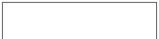
Схема границы эксплуатационной ответственности

_____ . (указать адрес, наименование объектов и оборудования, по которым определяется граница балансовой принадлежности организации водопроводно-канализационного хозяйства и заказчика)